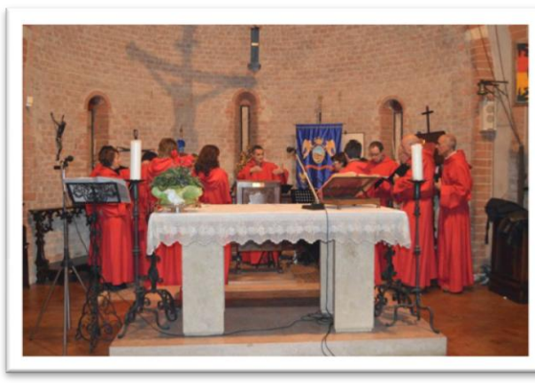
il Concerto del Coro "Audite Nova"