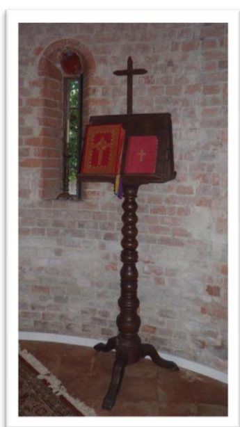
Antifonaria prima del restauro