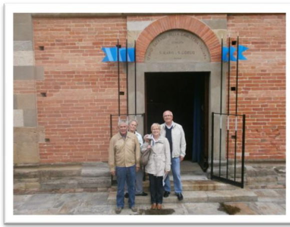
Visitatori da Padova

L'organizzatrice della gita da Padova ha inviato il seguente messaggio di ringraziamento: "Caro Priore (mi permetta di chiamarla così) la visita è stata superiore alle nostre aspettative grazie anche alla gentilezza ed alla competenza dei due signori che ci hanno accolto.