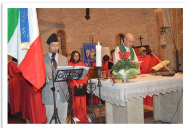
la Preghiera del cavaliere