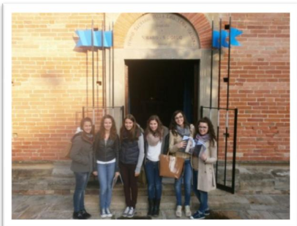
Liceo scientifico di Voghera

- 18 ottobre: Visita del IV Liceo Scientifico di Voghera e di un gruppo proveniente da Padova.