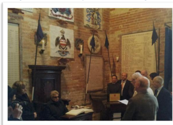
la benedizione dello Stemma "Voloire"