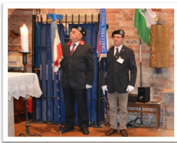
gli Stendardi del Tempio e della Sez. di Voghera