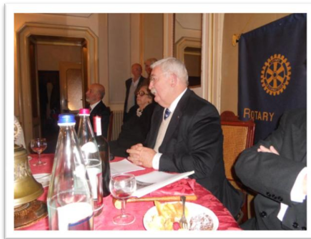
la Conferenza tenuta dal priore

Il Priore del Tempio, che era presente alla celebrazione della Santa Messa, nel prosieguo della serata ha intrattenuto i Soci e gli ospiti del Club nella loro sede di Voghera con una conferenza dal titolo: "Amedeo Guillet, un eroe moderno" .