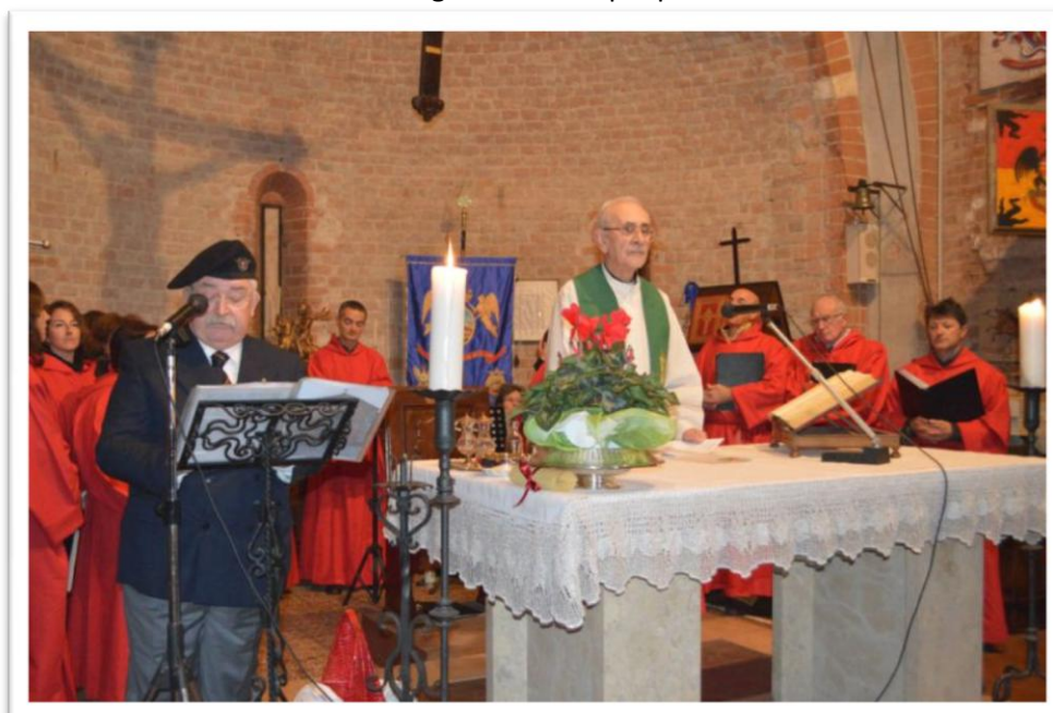
La commemorazione dei fatti di Pozzuolo del Friuli.

Contrariamente a quanto annunciato nel precedente Notiziario, nessun rappresentante delle "Voloire" è giunto al Tempio per la benedizione dello Stemma reggimentale.